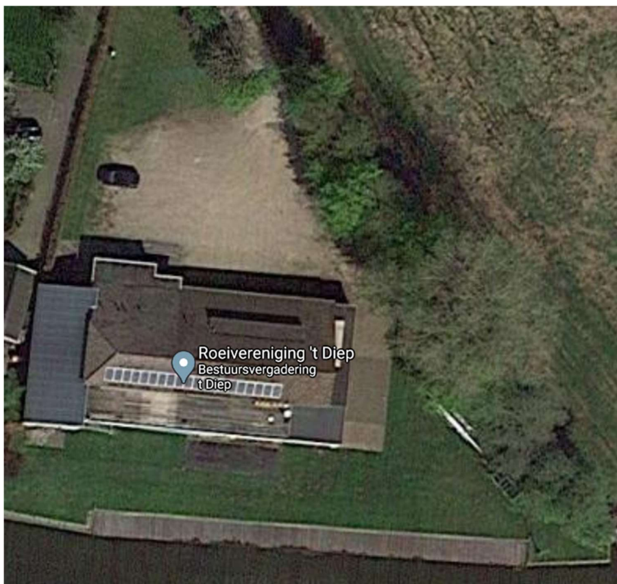
Figuur 1: Overzicht roeivereniging met van boven naar beneden: parkeerplaats, loodsen, grasveld en vlot.