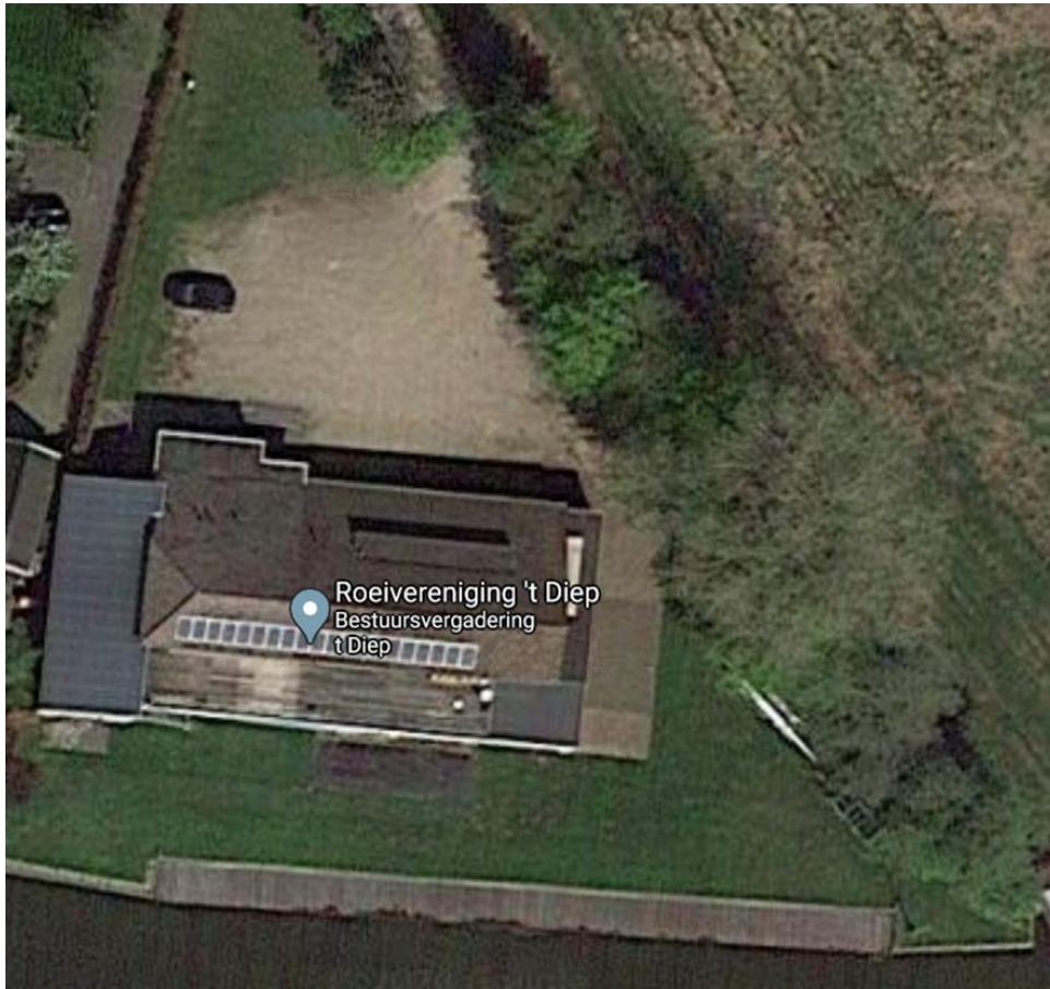
Figuur 1: Overzicht roeivereniging met van boven naar beneden: parkeerplaats, loodsen, grasveld en vlot.